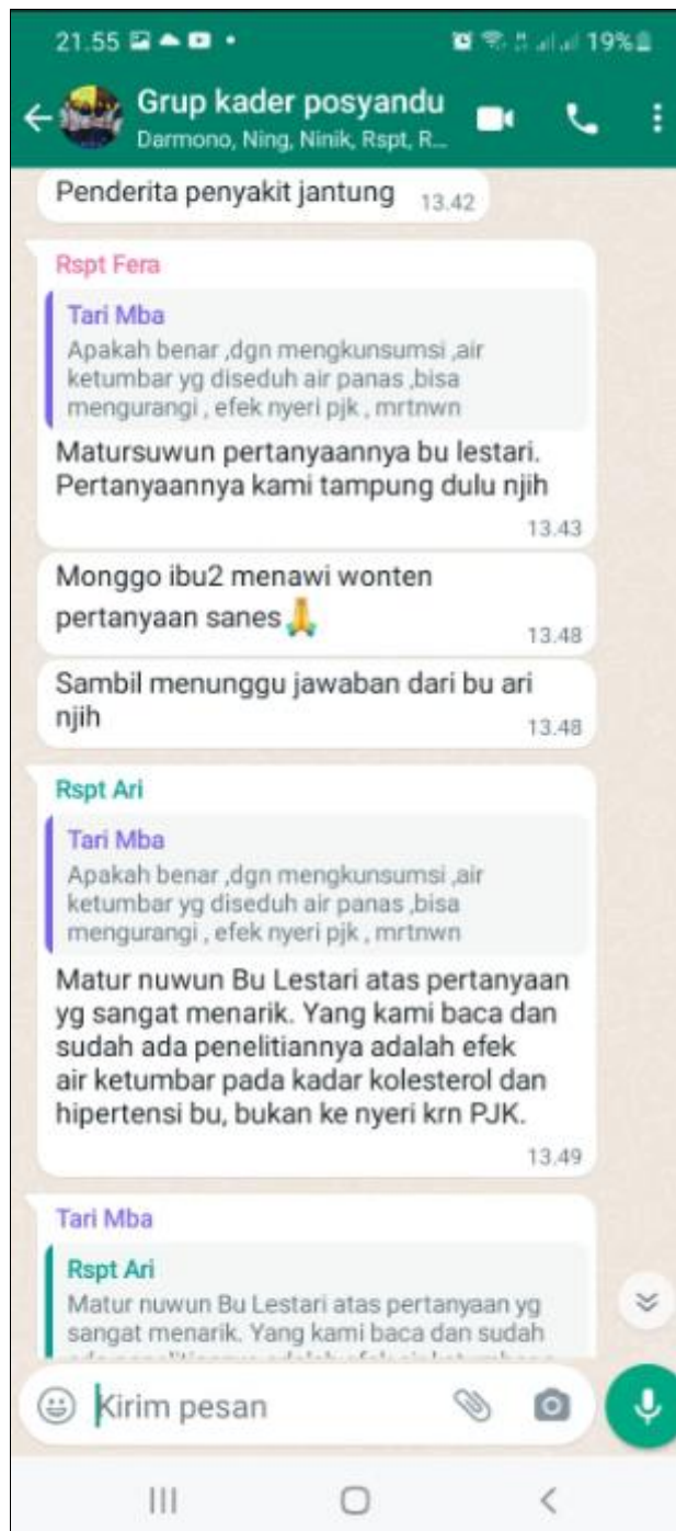
Gambar 6. Sesi tanya jawab

Selain pemberian materi mengenai penyusunan menu, masing-masing kader posbindu diberi penugasan berupa menyusun menu sehari bagi lansia dengan penyakit degenerative antara lain: DM, hipertensi, PJK dan gout arthritis. Semua kader posbindu menyusun menu sehari dan mengumpulkan kepada tim pengabdian. Berdasarkan koreksi hasil penyusunan menu sehari oleh tim pengabdian