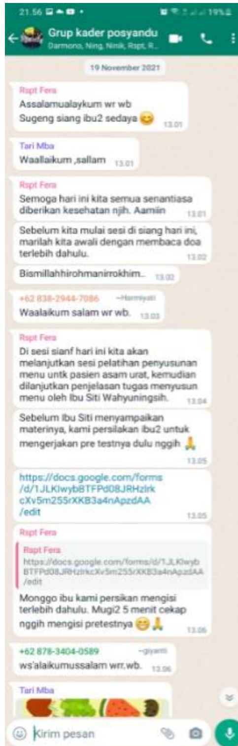
Gambar 4. Pelatihan penyusunan menu bagi lansia dengan gout arthritis dan penugasan bagi kader posbindu