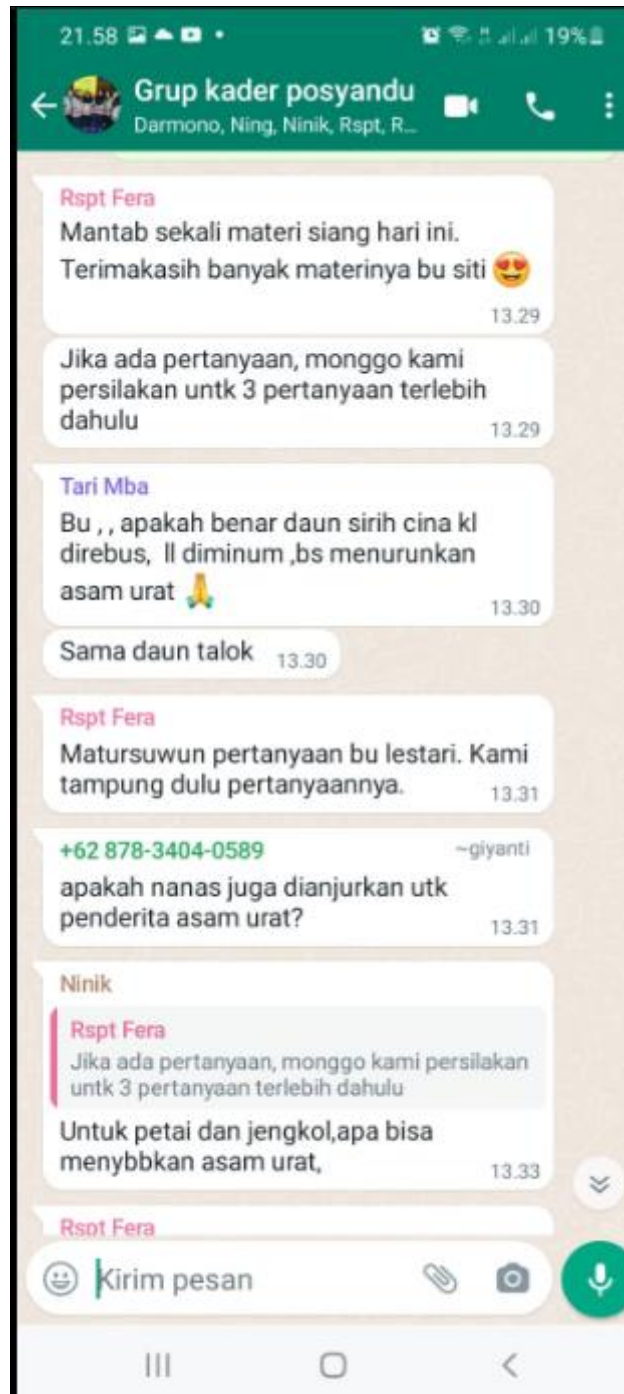
Gambar 5. Sesi tanya jawab