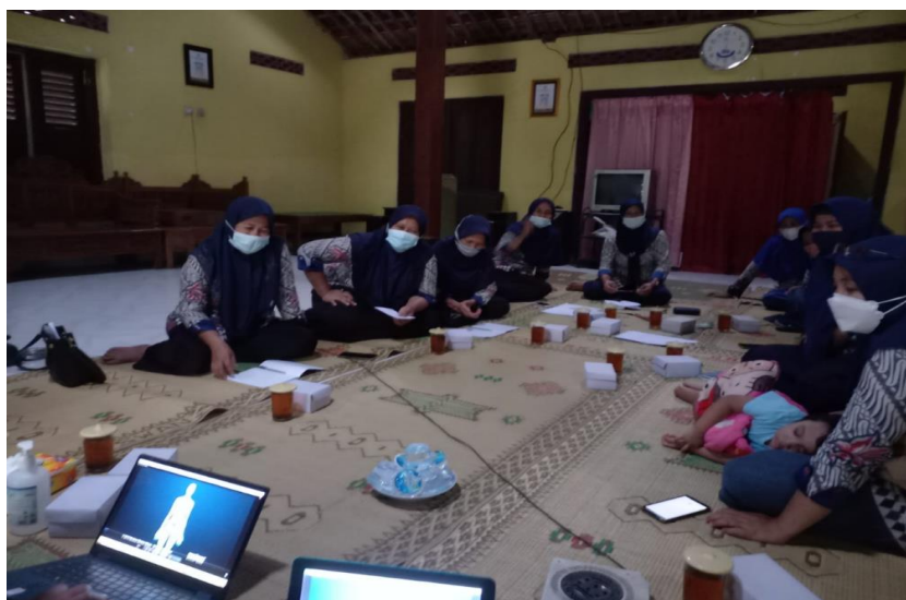
Gambar 1. Penjelasan materi mengenai masalah gizi pada lansia dan patofisiologi penyakit degeneratif