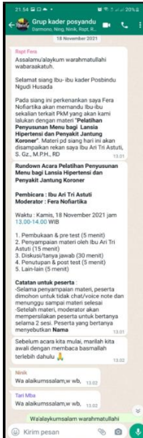
Gambar 3. Pelatihan penyusunan menu bagi lansia dengan hipertensi dan lansia dengan PJK