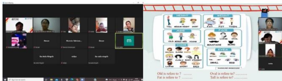
Gambar 4.3. Pelatihan hari ketiga

Pertemuan 3 berupa pelatihan mengenai Family yang diawali dengan pemaparan tim pengabdian mengenai struktur keluarga dan kosakata terkait dengan keluarga. Selain itu juga disampaikan penggunaan kosakata untuk mendeskripsikan anggota keluarga, seperti kondisi fisik, umur, sifat, pekerjaan, dan lainnya. Peserta diberikan latihan secara bergiliran menjelaskan keluarga masing-masing dan mendeskripsikan mereka dengan acuan template yang sudah disediakan tim pengabdian dalam materi pelatihan.