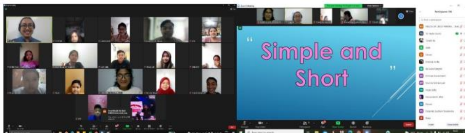
Gambar 4.1. Pelatihan hari pertama

Pertemuan 1 berisikan penyampaian materi oleh tim pengabdian mengenai Self-Introduction . Pada awal pertemuan dilakukan pengenalan diri oleh seluruh tim pengabdian sebagai gambaran bagi peserta didik mengenai Self-Introduction secara praktis. Kegiatan kemudian dilanjutkan pembahasan mengenai apa yang disampaikan, bagaimana ungkapan-ungkapannya, dan tense dasar apa yang dipergunakan pada saat pengenalan diri. Sebelum pertemuan diakhiri, seluruh peserta didik melakukan praktek pengenalan diri masing-masing sesuai template yang ditayangkan di layar.