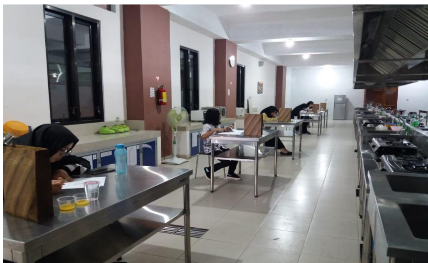
Gambar 2. Proses Penilaian Organoleptik Formula Minuman oleh Panelis

Hasil uji organoleptik menunjukkan ada perbedaan yang signifikan pada kedua formula tersebut dengan uji Mann Whitney pada indikator warna ( p=0,000 ) dan secara keseluruhan ( p=0,029 ). Formula yang paling disukai panelis adalah formula A. Formulasi minuman olahraga yang dilakukan mempertimbangkan beberapa persyaratan yaitu berdasarkan syarat dari BPOM yang menyatakan bahwa minuman olahraga harus berbahan dasar dari bahan yang aman, memiliki kandungan energi sekitar 240 kkal/L, osmolalitas < 340 mOsm/kg, kandungan natrium minimal 230 mg/L atau 10 mmol/L, kadar kalium maksimal 200 mg/L, pH maksimal 8,5 [6].